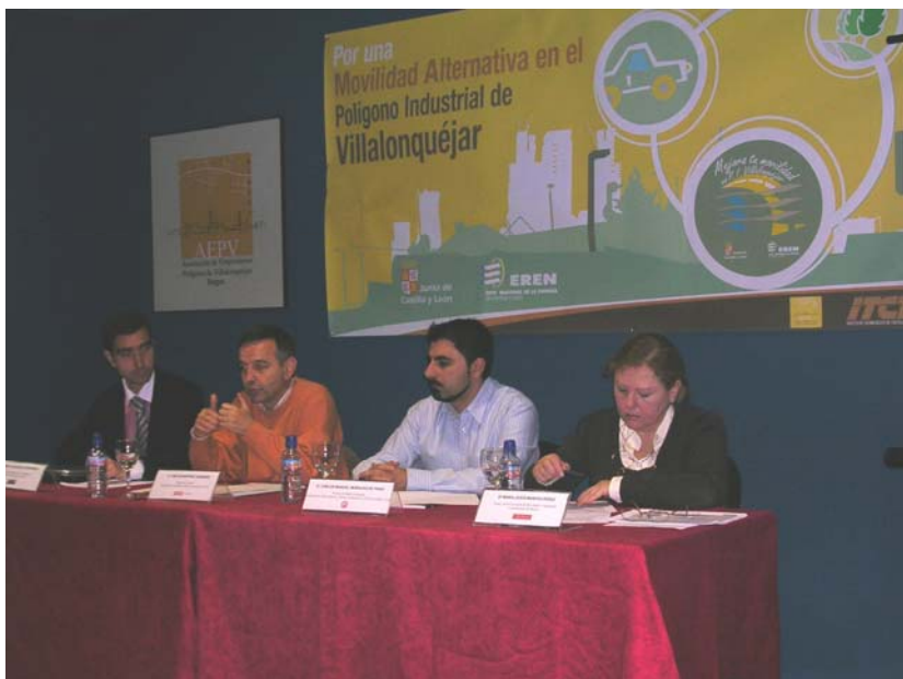
Jornada trabajo y movilidad sostenible. Jornada de formación y sensibilización para representantes sindicales y trabajadores organizada por la oficina de la movilidad.